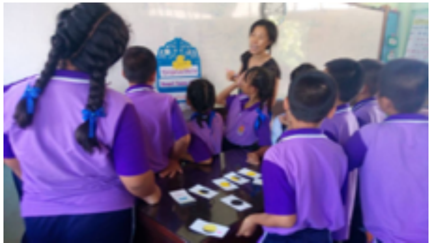
ออกแบบเกม โรงเรียนวัดจอมทอง 29 พฤษภาคม 2562