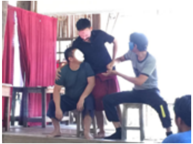
อบรมละครหน้ากาก โดยศิลปินอินโดนีเซีย Agus Gallis Sunardi 23-24 กุมภาพันธ์ 2562 ณ Empty Space สันป่าตอง เชียงใหม่