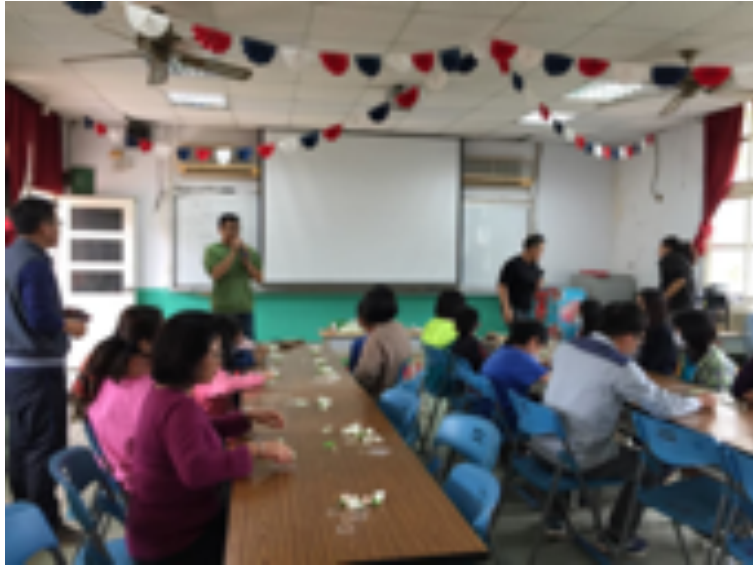
อบรมทำอุบะมาลี โรงเรียนประถมต้าผิง จังหวัดเหมียวลี่ ประเทศไต้หวัน 19 กันยายน 2562