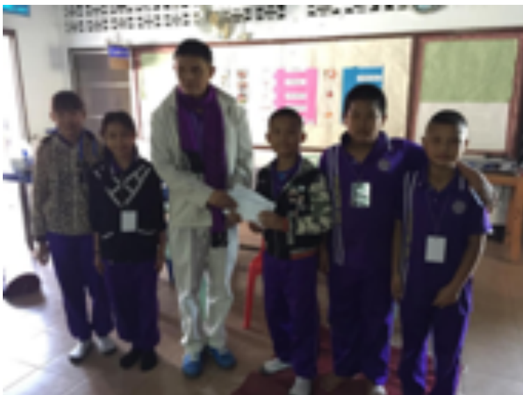
รายได้จากการฉายภาพยนตร์เรื่อง “มิติวิญญาณมหัศจรรย์” นักเรียนชั้นประถมศึกษาปีที่ 5 ผู้จัดได้ มอบให้โรงเรียนวัดจอมทอง